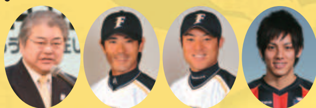
上田文雄札幌市長 北海道日本ハムファイターズ 稲葉篤紀選手 田中賢介選手 コンサドーレ札幌 古田寛幸選手